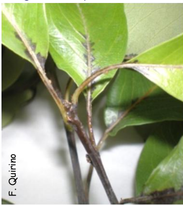
fig.2- pormenor das folhas de um raminho afectado