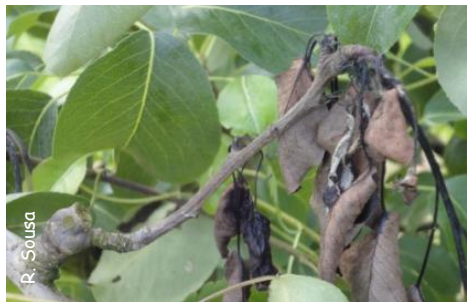
fig.1- pormenor de um raminho morto

É um organismo nocivo de quarentena descrito na Directiva da União Europeia 2000/63/EU (Anexo II/A2) e que faz igualmente parte da Lista A2 da OEPP