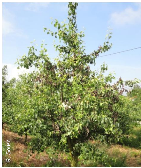
fig. 3 - aspecto geral de uma árvore afectada pela doença do fogo bacteriano