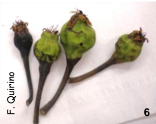
figs. 6 e 7 - aspecto da necrose parcial / total dos frutos afectados e aderentes ao corimbo .