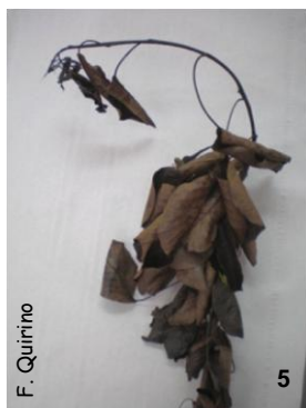
fig.5 - aspecto da curvatura e da necrose total de um raminho morto .

Nas folhas os sintomas são constituídos por manchas de cor castanha a negra quer próximas das margens, quer da nervura principal (fig. 8). Nos ramos e troncos desenvolvem-se lesões de cor avermelhada na zona sub-epidérmica e ao nível dos feixes lenhosos, que podem circundar o órgão, o qual acaba por morrer (figs. 9 e 10). Nestes, desenvolvem-se ainda cancros em depressão que podem ser confundidos com a presença de outras doenças de etiologia bacteriana. Em todos dos órgãos afectados é possível observar a presença, por vezes muito evidente, de exsudado bacteriano.