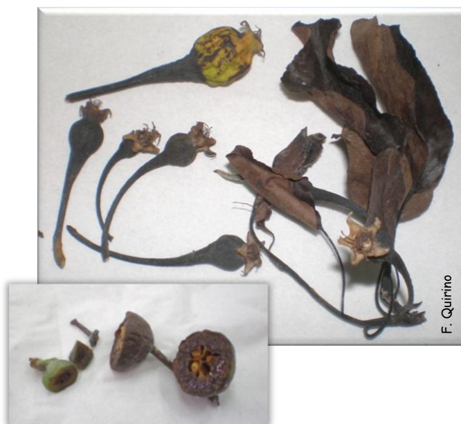
fig.4 - impacto económico da doença evidenciado pela destruição total dos frutos

Aquando dos focos iniciais Erwinia amylovora causa graves danos nos hospedeiros susceptíveis (fig.4), bem como em anos subsequentes, devido à destruição dos esporões. Em frequentes casos o recurso a podas sanitárias não permite salvar as árvores afectadas. É assim considerado um organismo nocivo de quarentena e uma grave ameaça à comercialização global de material de propagação vegetativa, uma vez que também afecta plantas ornamentais, as quais podem ser igualmente portadoras de infecções latentes.