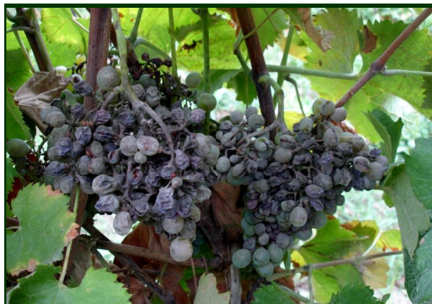
Oídio nos cachos em vinha descuidada

O oídio pode atacar os bagos de uva até ao pintor. No entanto, mesmo depois desta fase, havendo condições meteorológicas favoráveis, o oídio pode ainda atingir o pedúnculo e o ráquis (“cangaço”) do cacho. Em consequência, as uvas murcham, amadurecem mal ou acabam mesmo por necrosar.