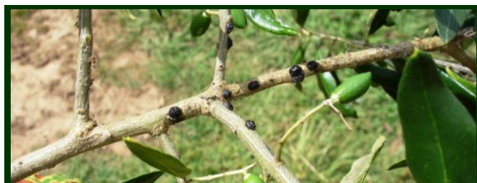
Cochonilha negra em oliveira

Em árvores com grande infestação de cochonilha-negra, com fumagina muito evidente, pode ser necessária a aplicação de um segundo tratamento, 3 a 4 semanas depois do primeiro.