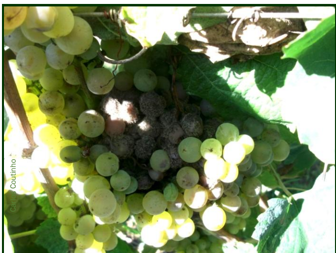
Podridão cinzenta no cacho

Fungicidas à base de cobre , entre outros, utilizados na luta anti-míldio, têm ação secundária contra a podridão cinzenta.