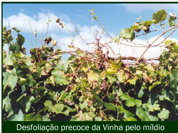
Desfoliação precoce da Vinha pelo míldio

A Vinha encontra-se, maioritariamente, no fecho do cacho - L (BBCH 77). Em alguns locais, observa-se um início muito precoce do pintor (estado M (BBCH 81)).