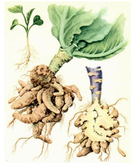
Tumores causados nas raízes pela potra da couve

herbicida e outras propriedades, é a cianamida cálcica . Esta, por ser um adubo cáustico, deve ser incorporada no terreno pelo menos 15 dias antes da plantação.