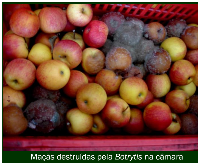
Maçãs destruídas pela Botrytis na câmara

Calcula-se que as podridões resultantes constituem cerca de 9/10 do total do risco de perdas em fim de conservação . As podridões de câmara são muito variáveis, conforme a origem geográfica da produção e as variedades a conservar.