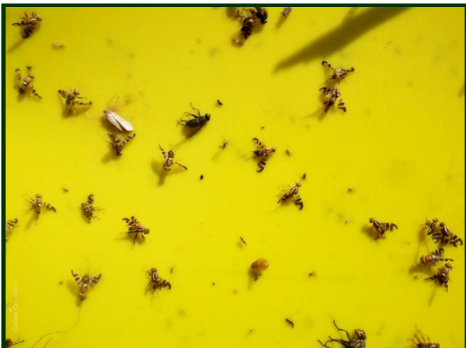
Moscas da casca verde da noz, capturadas na armadilha amarela (tamanho próximo do natural).

Estão também homologados: SPINTOR ISCO, DECIS TRAP Completa, BORAVI 50 WG e FLYPACK® COMPLETA.