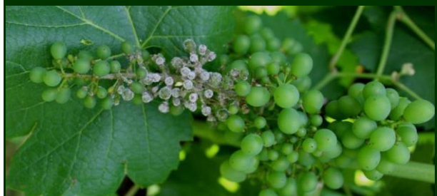
Míldio esporulado no cacho (rot gris)