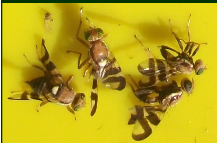
Figura 2. Adultos, mostrando o característico padrão das asas e os olhos verde-azulados, em imagem muito ampliada.