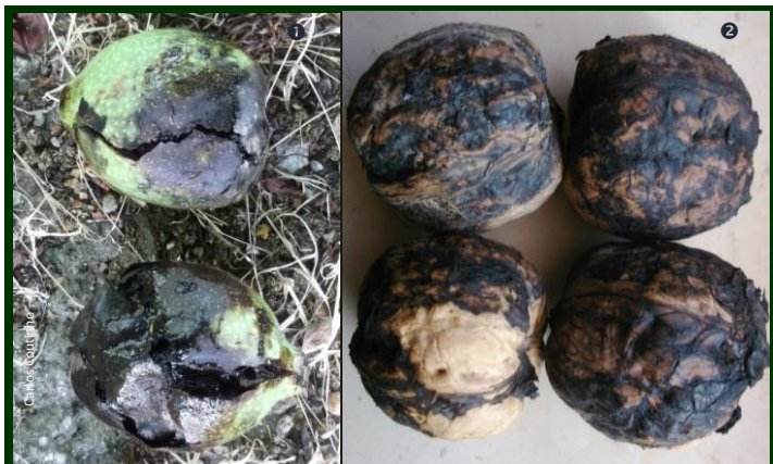
Figura 5. ❶ Nozes tombadas, em consequência do ataque de Rhagoletis completa , com a casca enegrecida e em decomposição. ❷ Nozes desvalorizadas, com os restos da casca verde decomposta e seca colados.

As nozes apresentam manchas negras, que vão alastrando, por vezes atingindo todo o fruto (não confundir com manchas de bacteriose (Fig. 7). A casca verde apodrece, toda ou em parte.