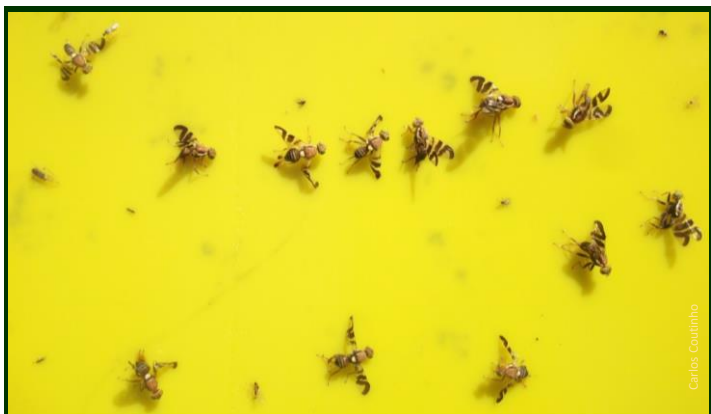
Figura 1. Adultos de mosca da casca verde da noz, capturados em armadilha cromotrópica, em tamanho próximo do natural.

A mosca da casca verde da noz é originária da América do Norte. Está classificada como organismo de quarentena na Europa. Foi identificada pela primeira vez em Portugal, na Região de Entre Douro e Minho, no verão de 2014. Como foi encontrada ao mesmo tempo em diversos concelhos, do litoral para o interior, é provável que já antes estivesse instalada na Região. Encontra-se agora por toda o Entre Douro e Minho.