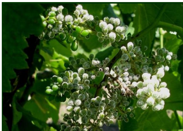
Não confundir os sintomas do míldio ↑ com os do oídio →

A Vinha encontra-se numa fase de grande sensibilidade ao oídio e as condições meteorológicas são-lhe bastante favoráveis . Temos registado o desenvolvimento acelerado desta doença nos últimos dias.