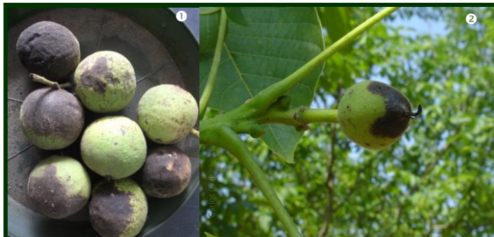
Figura 6. ❶ Frutos de noqueira negra ( Juglans nigra ) atacados pela mosca da casca verde ❷ Mancha de bacteriose

Em ataques muito fortes, fica apenas um resto desta casca, negra e seca, agarrada à noz (Fig. 5).