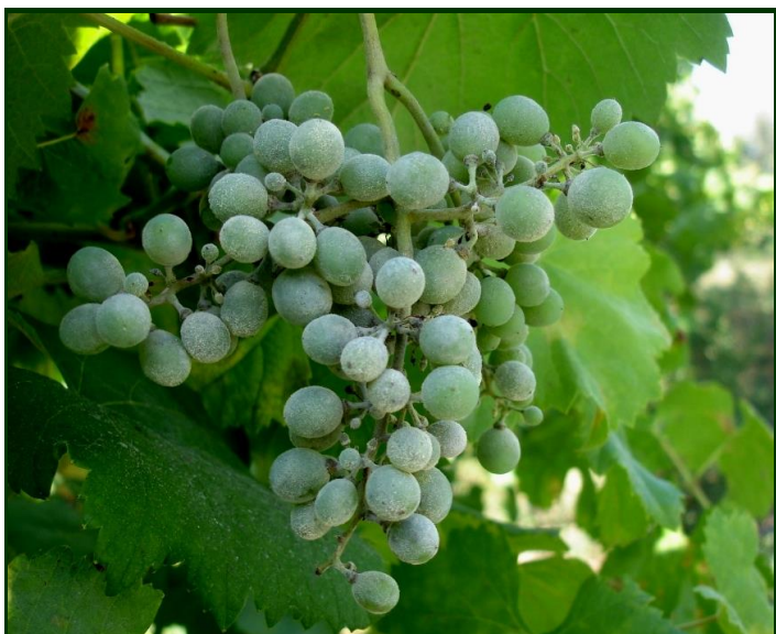
Oídio no cacho

Existe risco até ao início do pintor . Desfolhas e despampas ligeiras favorecem a entrada do ar e da luz do sol nos cachos, que contraria o desenvolvimento do oídio. Mantenha a vinha protegida.