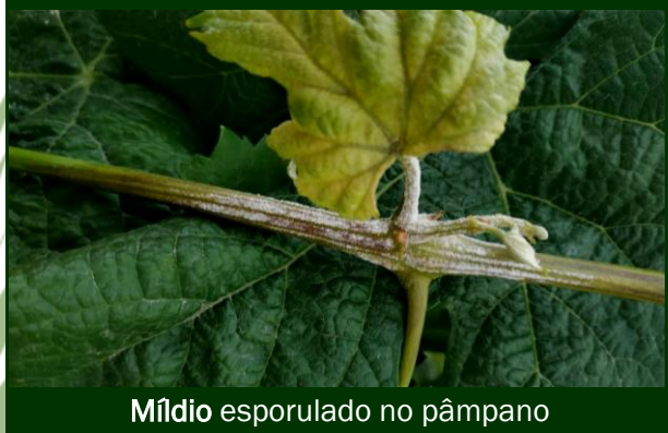
Míldio esporulado no pânpano