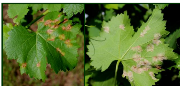
Míldio na folha ↖ face superior e ↗ inferior

A Vinha encontra-se, conforme os locais e castas, no estado dominante de grão de chumbo (BBCH 72-74) - grão de ervilha - K (BBCH 75-76) . Vinhas mais atrasadas, já poucas, estão na alimpa - J (BBCH 65-71) e as mais precoces no início do fecho do cacho - L (BBCH 77) .