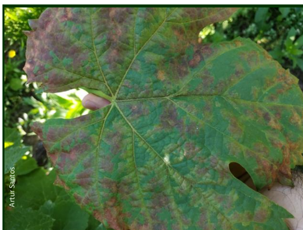
Manchas de míldio em parte necrosadas (página superior da folha)

O aumento acentuado das temperaturas nos últimos dias e a humidade relativa do ar, sobretudo noturna, muito elevada, são favoráveis a novas infeções e ao desenvolvimento do míldio.