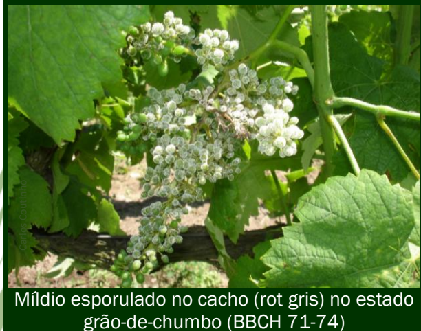
Míldio esporulado no cacho (rot gris) no estado grão-de-chumbo (BBCH 71-74)

A previsão de períodos de chuva durante a próxima semana, virá aumentar as condições de humidade favoráveis a infeções