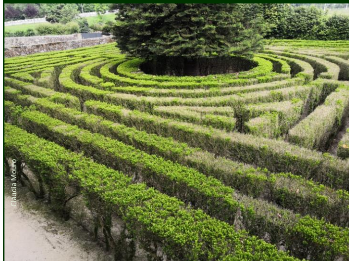
O mesmo conjunto, alguns meses depois, sujeito a trabalhos de recuperação