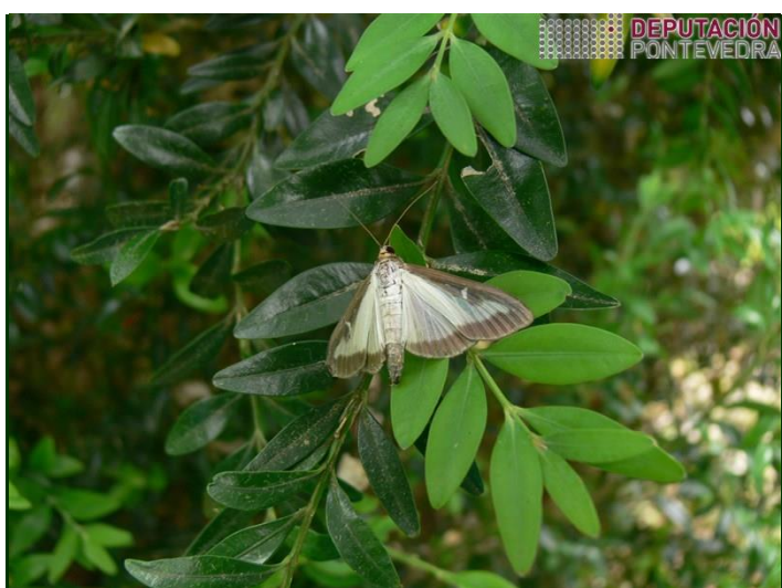
Adulto de traça-do-buxo - imagem ligeiramente ampliada

Para ajudar a recuperar as plantas muito desfolhadas pela traça, aplique um adubo azotado no solo, ao alcance das raízes do buxo.