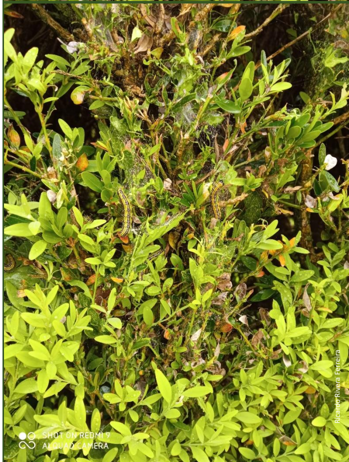
Larvas de traça do buxo, perto do estado final do seu desenvolvimento (foto de 31/03/2021)

Estes aparelhos têm ainda a vantagem de pulverizar uniformemente toda a área foliar, já que originam gotas mais finas.