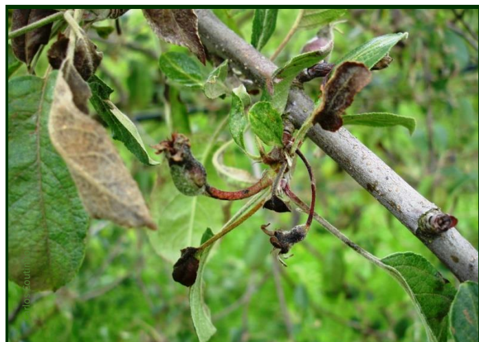
Frutos atingidos por ataque precoce de pedrado

A maioria das variedades e árvores estão agora num estado fenológico de grande sensibilidade ao fungo.