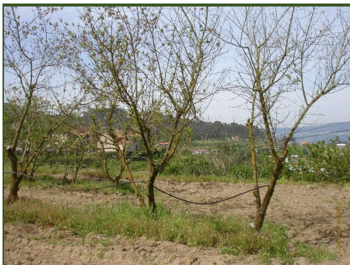
Desfoliação de pessegueiros atingidos pela lepra

Ataques graves podem causar a queda de elevado número de folhas. Os frutos atingidos não se desenvolvem ou caem, sobretudo quando são ainda muito pequenos