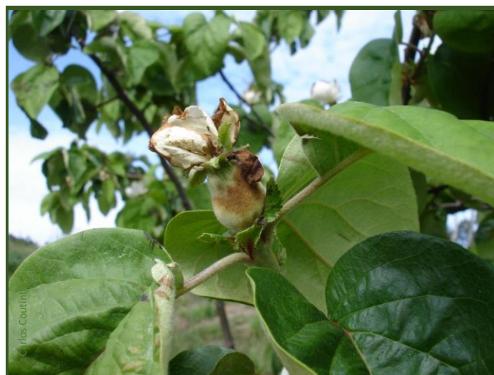
Jovem fruto atingido pela moniliose

À queda das pétalas, aplique um fungicida contra a moniliose nas árvores ou nas variedades e locais onde se observam ataques frequentes desta doença, que pode levar à perda de muitos frutos, na altura do vingamento e depois.