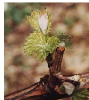
Estado E (folhas livres)