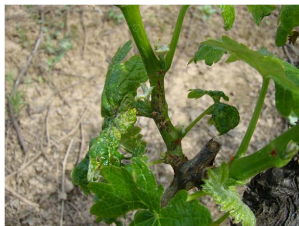
Fotos de escoriose, na vara e folha.

Devendo o Sr. Agricultor contactar a Estação de Avisos para qualquer esclarecimento adicional.