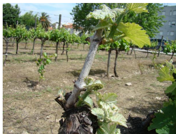
Fotos de escoriose, na vara do ano anterior.