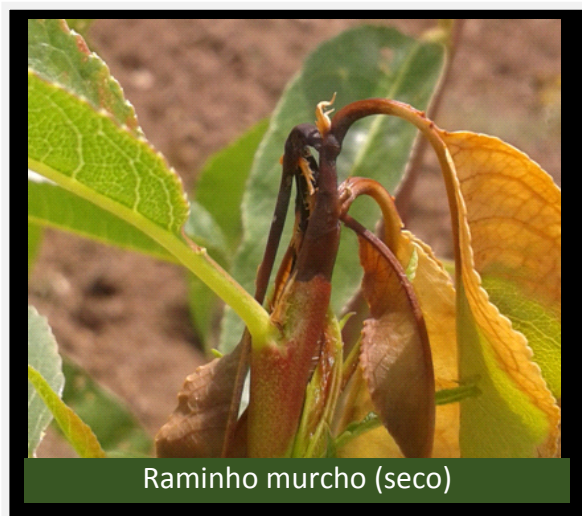
Raminho murcho (seco)

iniciam a sua atividade para penetrar no interior dos gomos e novos rebentos, dos quais se alimenta para atingir a fase de pupa dentro de um casulo sedoso, geralmente entre duas folhas de amendoeira. Posteriormente emergem os adultos, no final da primavera. Estes adultos começam a efetuar a postura, passadas duas semanas emergem as larvas para se alimentarem de frutos e nova rebentação, apresentando-se os frutos com gumose, os rebentos roídos e as folhas e ramos murcham e morrem.