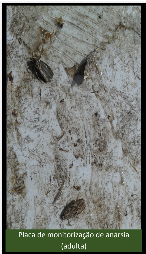
Placa de monitorização de anársia (adulta)

Anarsia, lepidóptera que ataca principalmente prunoideas e algumas pomoideas,