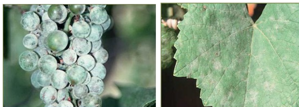
Oídio na folha e no cacho

Se, em alternativa, e o estado do tempo o permitir utilizar enxofre em pó, procure não fazer este tratamento com temperaturas elevadas – acima dos 32°C - e a planta molhada, para evitar riscos de fitotoxicidade – (queima).