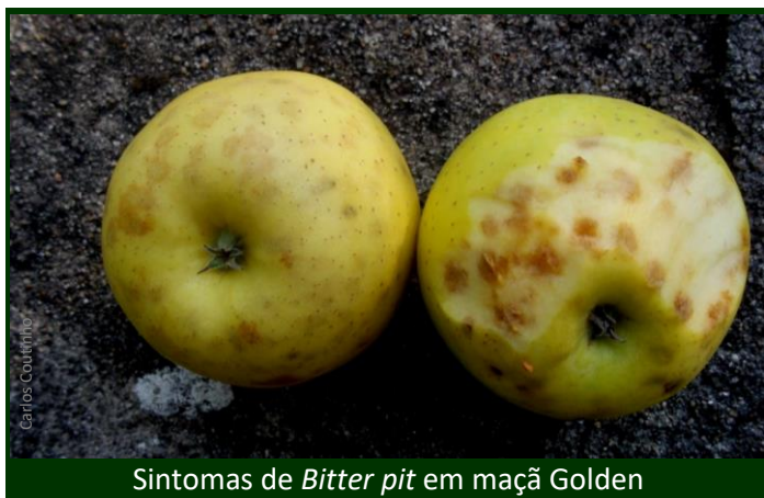
Sintomas de Bitter pit em maçã Golden

▶ Na plantação ou reconstituição de pomares, devem escolher-se variedades pouco sensíveis ao bitter pit , visto que este acidente tem origem predominantemente genética.