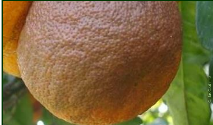
Laranja destruída pelo míldio