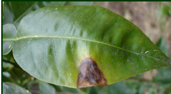
Mancha de míldio numa folha de laranjeira