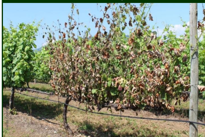
Videira afetada pelo síndrome da esca, morta repentinamente, durante o verão.