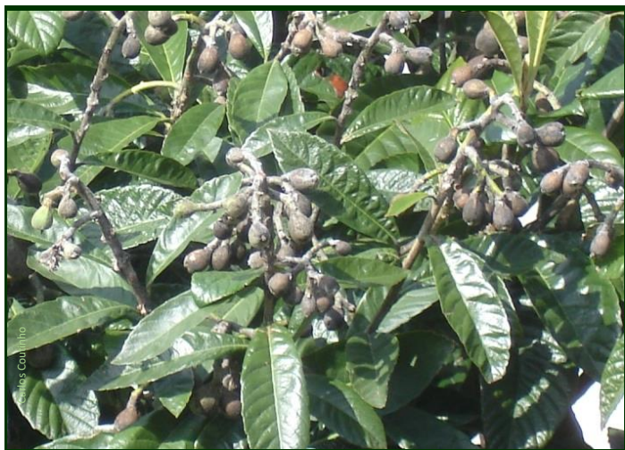
Sintomas de pedrado da nespereira-do Japão em frutos