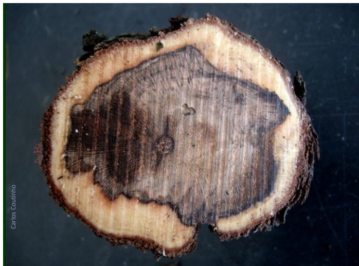
Sintomas primários no tronco de videira jovem (corte transversal)

► A lenha de poda, mesmo com sintomas de esca, também pode ser devolvida à terra. Para tal deve ser triturada mecanicamente e compostada , durante pelo menos 6 meses. As temperaturas atingidas no processo de compostagem, destroem os fungos presentes na lenha. O composto pode ser então espalhado na vinha, quer constituindo um mulsching na linha, impedindo a emergência de infestantes, quer como fertilizante orgânico.