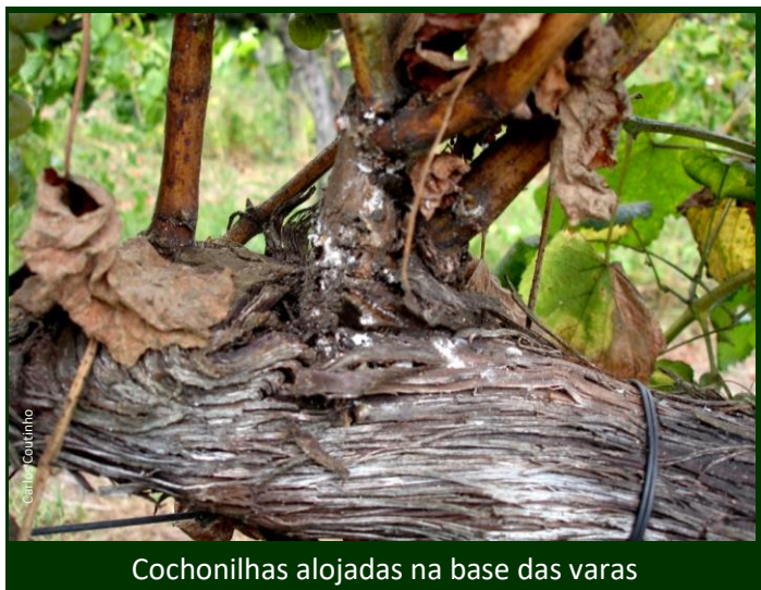
Cochonilhas alojadas na base das varas

Consulte aqui a Ficha Técnica nº 43 (II Série)