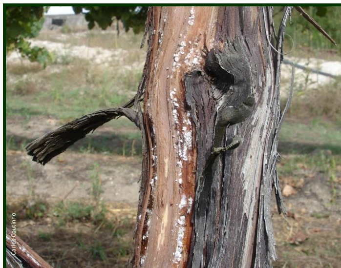
Cochonilhas abrigadas sob a casca da videira, onde sobrevivem durante o inverno

O frio do inverno pode ser suficiente para eliminar uma parte importante da população. No entanto, pode fazer-se um tratamento localizado destas videiras, utilizando um óleo parafínico (dito óleo de verão) . O óleo de verão não deve ser aplicado com temperaturas inferiores a 5°C.