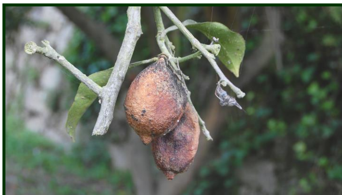
Limões mumificados, destruídos pelo míldio

No Modo de Produção Biológico são autorizados fungicidas à base de cobre para a luta contra o míldio e a gomose basal.