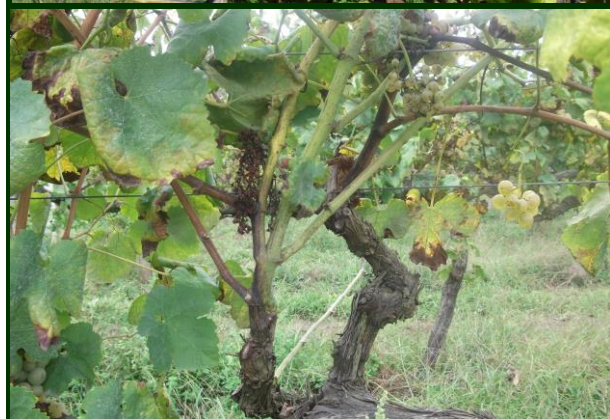
Sintomas de flavescência dourada: varas por atemper, no período pós-vindima

SÍNDROME DA ESCA ( Phaemoniella chlamydospora , Phaeoacremonium spp. , Fomitiporia mediterranea e outros)