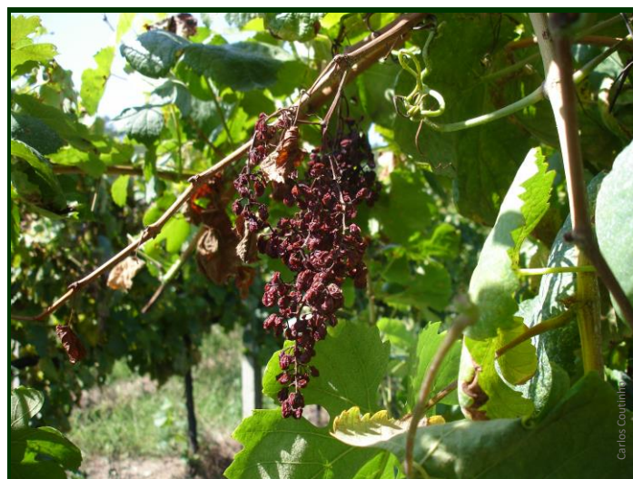
Como noutras doenças do lenho, o pé-negro pode levar ao dessecamento dos cachos

► Não exigir que as videiras atinjam grandes produções muito cedo, sem que o seu sistema radicular esteja bem desenvolvido.