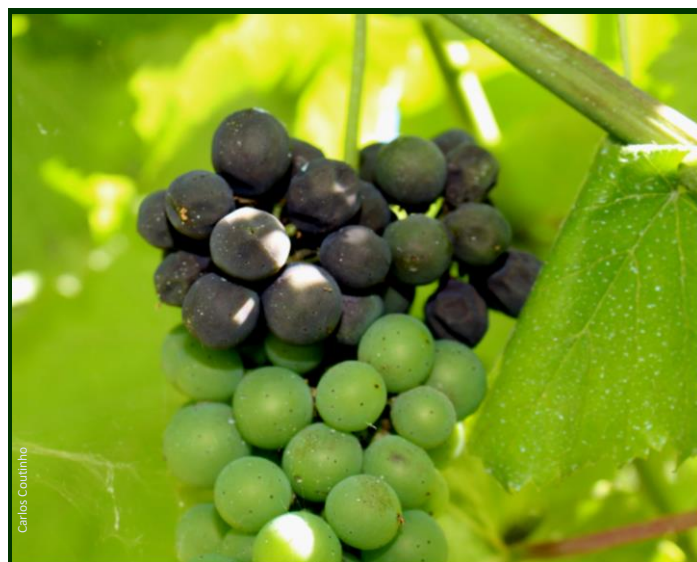
Bagos atingidos pela podridão negra.

O uso de produtos à base de Trichoderma é autorizado no Modo de Produção Biológico e nos outros modos de produção.