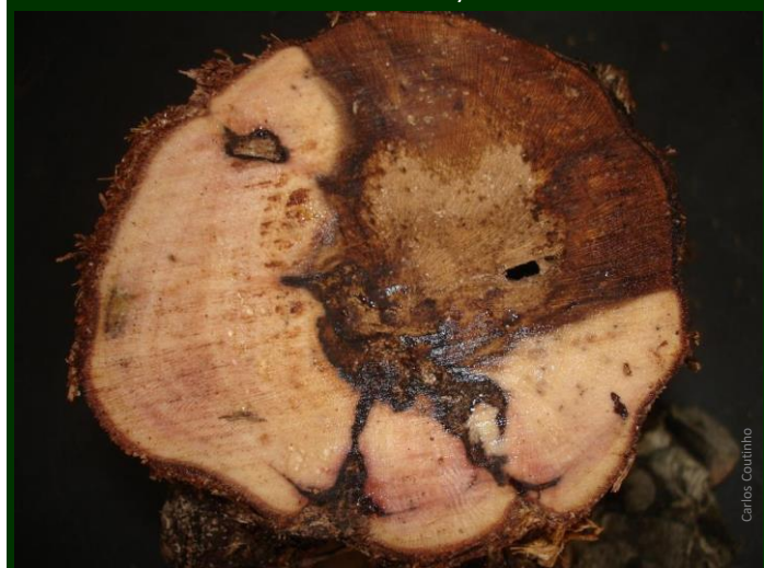
Sintomas primários no tronco de videira adulta (corte transversal).