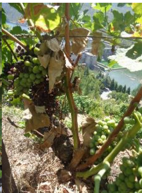
Sintomas de Botriosférioze na Vara.

Como estes fungos não vivem no solo, mais tarde podem ser plantadas novas videiras no mesmo local, sem perigo de contaminação.