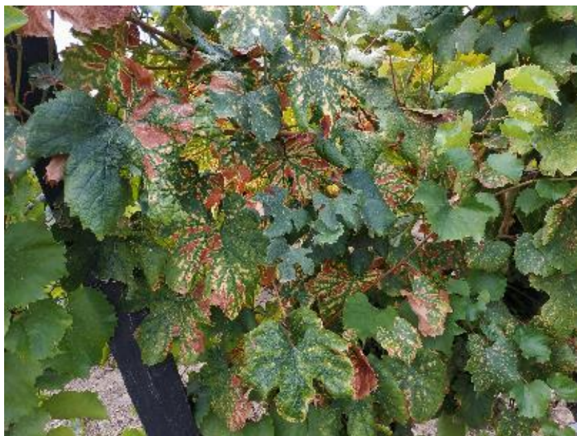
Sintomas de Esca na Folha.