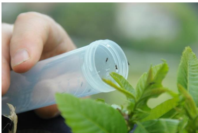
Largada de Torymus sinensis (adultos a sair do frasco)

Se o fizer, estará a inutilizar o trabalho de muitas pessoas e os elevados investimentos feitos nos últimos anos. Além disso, estará a comprometer o êxito do único processo viável de controlo desta grave praga dos castanheiros.